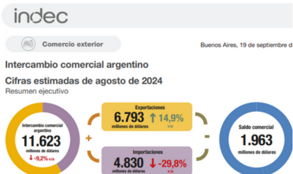
Exportaciones por grandes rubros e importaciones por usos económicos. En millones de dólares, participación y variación porcentual. Agosto de 2024

En agosto de 2024, las exportaciones totalizaron 6.793 millones de dólares y las importaciones, 4.830 millones de dólares. Como resultado, el intercambio comercial (exportaciones más importaciones) disminuyó 9,2% en relación con igual mes del año anterior y alcanzó un monto de 11.623 millones de dólares. La balanza comercial registró un superávit de 1.963 millones de dólares y un resultado positivo por noveno mes consecutivo.